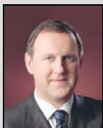
Minister Dirk Van Mechelen

Dirk Van Mechelen , Vlaams Minister van Financiën, Begroting en Ruimtelijke Ordening